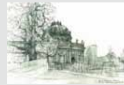
Muzeum Bodego Bode-Museum ← → Zamek Charlottenburg Schloss Charlottenburg