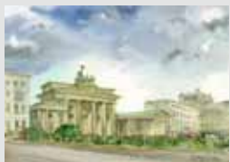
Brama Brandenburska Brandenburger Tor ← → Nowa Synagoga Neue Synagoge