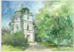
Pałacyk Belvedere Schlösschen Belvedere im Park Charlottenburg ← → Plac Poczdamski Potsdamer Platz