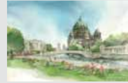
Katedra Berlińska, widok z James-Simon-Park Berliner Dom, Blick vom James-Simon-Park ←