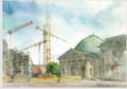
Katedra Św. Jadwigi Sankt-Hedwigs-Kathedrale ← → Federalny Urząd Kancelerski Bundeskanzleramt