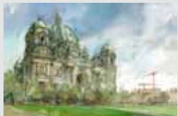
Katedra Berlińska elewacja frontowa Berliner Dom, Vorderfassade ←