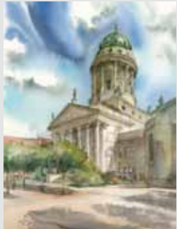
Katedra Francuska Gendarmenmarkt Französischer Dom ← → Cerkiew Prawosławna Zmartwychwstania Chrystusa Russisch-Orthodoxe Christi-Auferstehungskathedrale