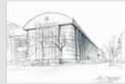
Fabryka Turbin AEG AEG-Turbinenfabrik, Siemens ← → Czerwony Ratusz Rotes Rathaus