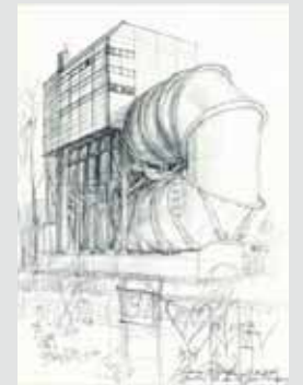
→ Zakład doświadczalny budownictwa okrętowego „Różowa Rura” Schiffbau-Versuchsanstalt „Rosa Röhre”